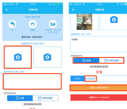
トラブル問合せ画面